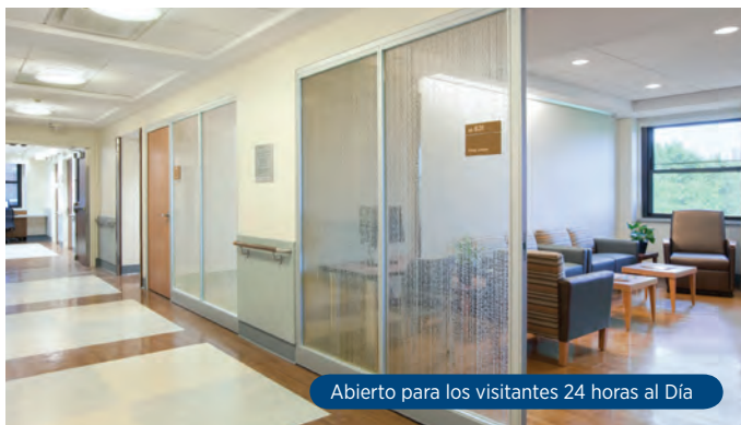
Abierto para los visitantes 24 horas al Día